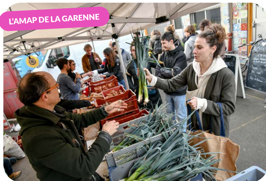
L'AMAP DE LA GARENNE

Novembre a été nommé Mois de l'économie sociale et solidaire (ESS) par les chambres régionales de ce domaine, les CRESS. On compte parmi les acteurs de l'ESS un grand nombre d'associations, coopératives, mutuelles... qui œuvrent pour un projet social et collectif plutôt que pour un objectif lucratif, souvent avec un engagement écologique. Voici quelques-unes de ces structures et projets à Clichy.