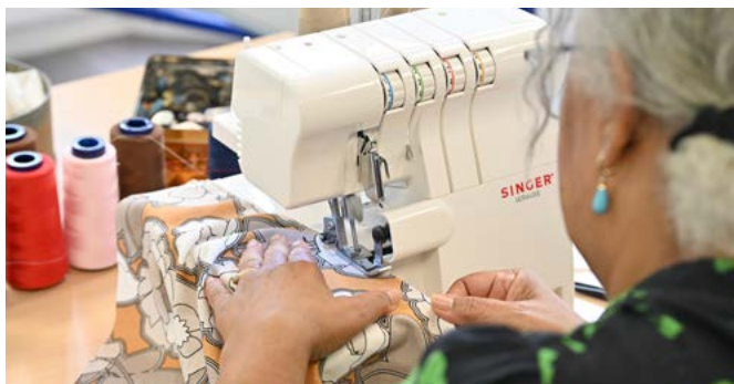
Le centre Boisseau propose un atelier couture avec une intervenante, deux fois par semaine.