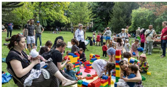
Le centre Boisseau propose un atelier couture avec une intervenante, deux fois par semaine.