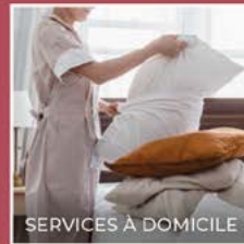
SERVICES À DOMICILE