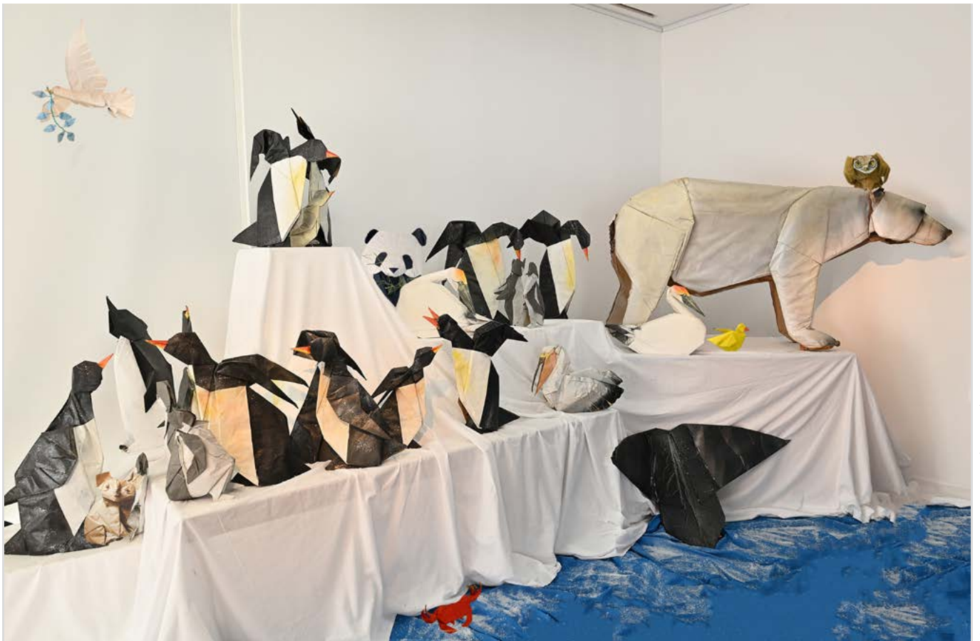
L'exposition La faune en plis, l'art de l'origami vous attend au Pavillon Vendôme. - Solution au prochain numéro